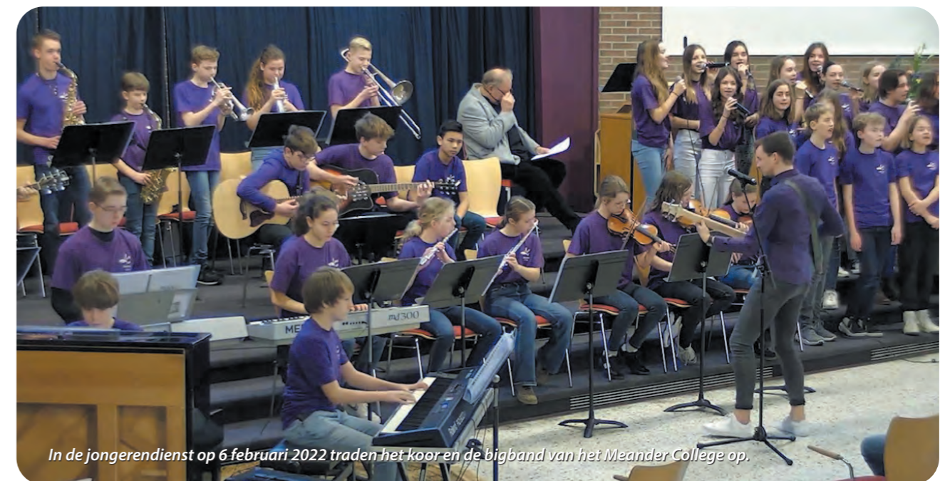
In de jongerendienst op 6 februari 2022 traden het koor en de bigband van het Meander College op.

Door: Dirk Jan Steenbergen, namens de beroepskrachten Adventskerk-Oosterkerk