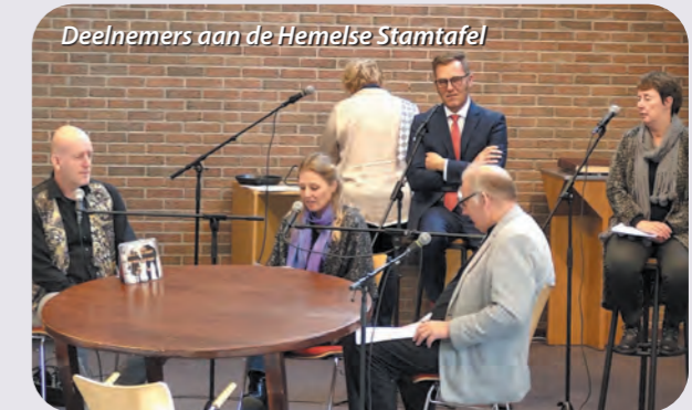
Deelnemers aan de Hemelse Stamtafel

De viering wordt voorbereid in minimaal twee avonden. De eerste avond is dat een geloofsgesprek over het gekozen thema. De tweede avond liggen er een aantal voorstellen voor een viering die opgesteld wordt naar aanleiding van de eerste bijeenkomst. Samen wordt dan gezocht naar werkvormen, liederen, verhalen etc. die onderdeel zijn van de liturgie. Op eventueel een derde avond vindt de verdere praktische voorbereiding en eventueel oefening plaats. De Hemelse stamtafel verzorgt vier keer per jaar een viering.