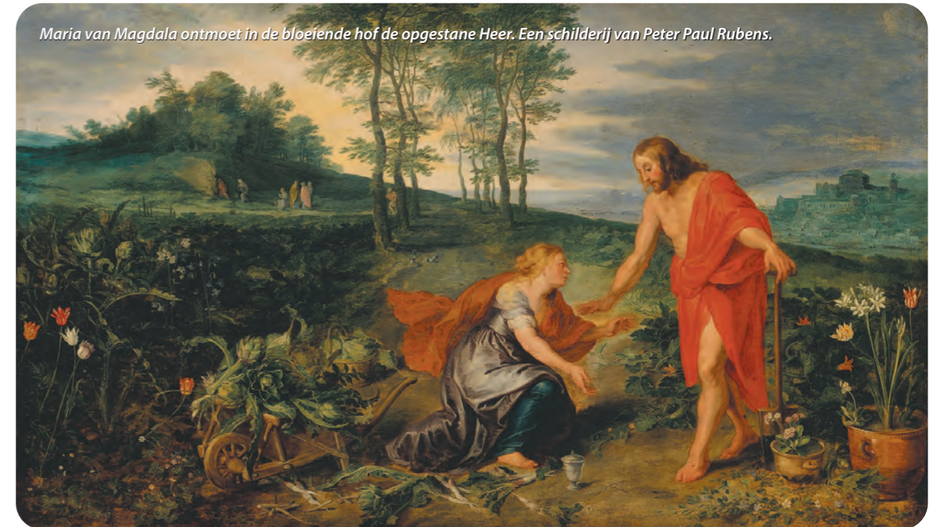
Maria van Magdala ontmoet in de bloeiende hof de opgestane Heer. Een schilderij van Peter Paul Rubens.