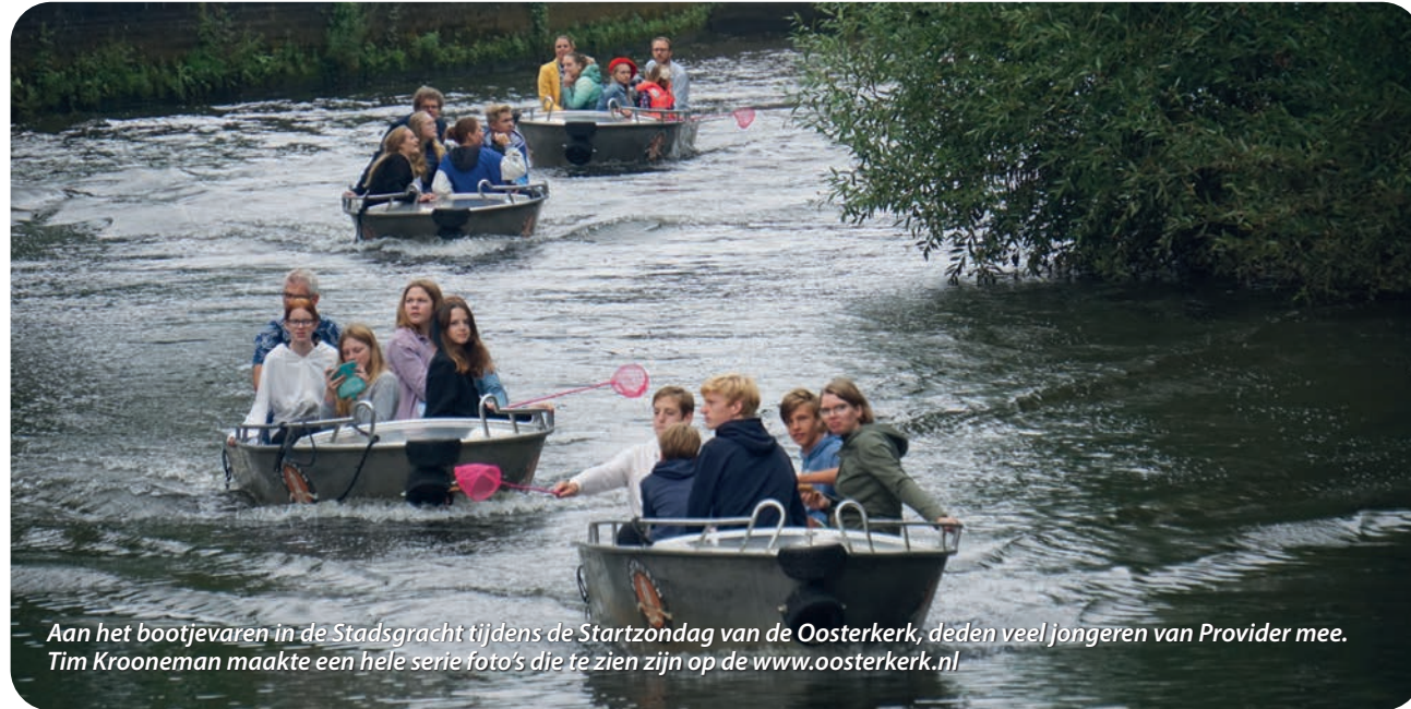
Aan het bootjeven in de Stadsgracht tijdens de Startzondag van de Oosterkerk, deden veel jongeren van Provider mee. Tim Krooneman maakte een hele serie foto's die te zien zijn op de www.oosterkerk.nl

Vinden wij het nog belangrijk dat onze kinderen naar de kerk gaan? En wat is precies de kerk? Is dat de zondagochtend? Wat vinden wij in de kerk en in het geloof dat wij dat ook aan onze kinderen gunnen? In het kader van de steeds verdergaande samenwerking en het uitwerken van de plannen daarvoor, stelden wij onszelf deze vragen.