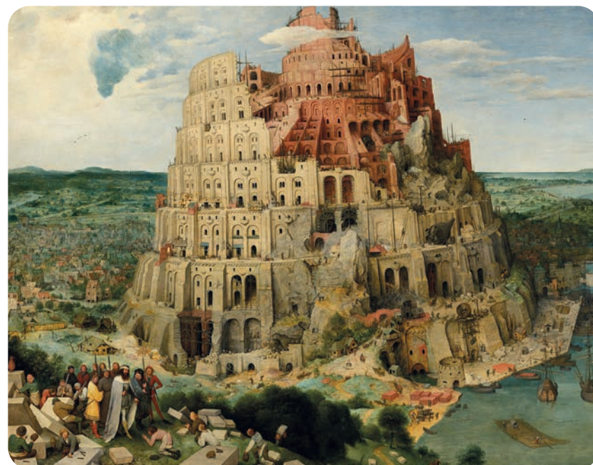
Pieter Bruegel de Oudere maakte een van de bekendste schilderijen van de Toren van Babel.